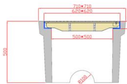
Figure 1 à titre indicatif :